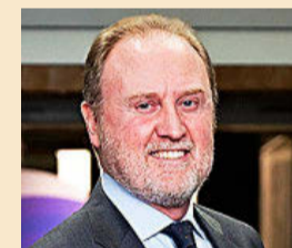
Ramón Galcerán, presidente de Grant Thornton España.